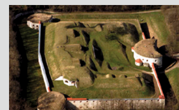
Fort Oberer Kuhberg

Das Fort Oberer Kuhberg An diesem Werk wird beispielhaft die Aufgabe eines Forts der Bundesfestung erklärt. Hier befindet sich heute das Festungsmuseum des Förderkreises Bundesfestung Ulm. Außerdem informiert die Gedenkstätte über das Konzentrationslager, das die Nationalsozialisten hier von 1933 bis 1935 eingerichtet hatten.