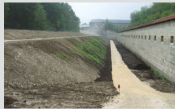
Östliche Seite der Wilhelmsfeste mit Blick auf die Wilhelmsburg

stellte die Verbindung zur Oberen Gaisenbergbastion her und markiert den Beginn der östlichen Bergfront. Der Dr.-Otmar-Schäufelen-Weg, der durch diesen Teil des Ulmer Glacisparcs führt, ist nach einem der Gründer des Förderkreises Bundesfestung Ulm e. V. benannt.