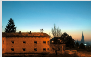
Doppelcaponniere der Kienlesbergbastion

In der Doppelcaponniere der Kienlesbergbastion befindet sich seit den 1970er Jahren der »Club Action«.