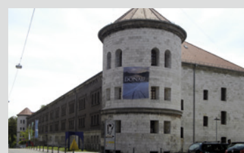
Reduit der Oberen Donaubastion

Das Reduit der Oberen Donaubastion wurde nach dem Zweiten Weltkrieg als Notunterkunft genutzt und ist seit dem Jahr 2000 Sitz des Donauschwäbischen Zentralmuseums.