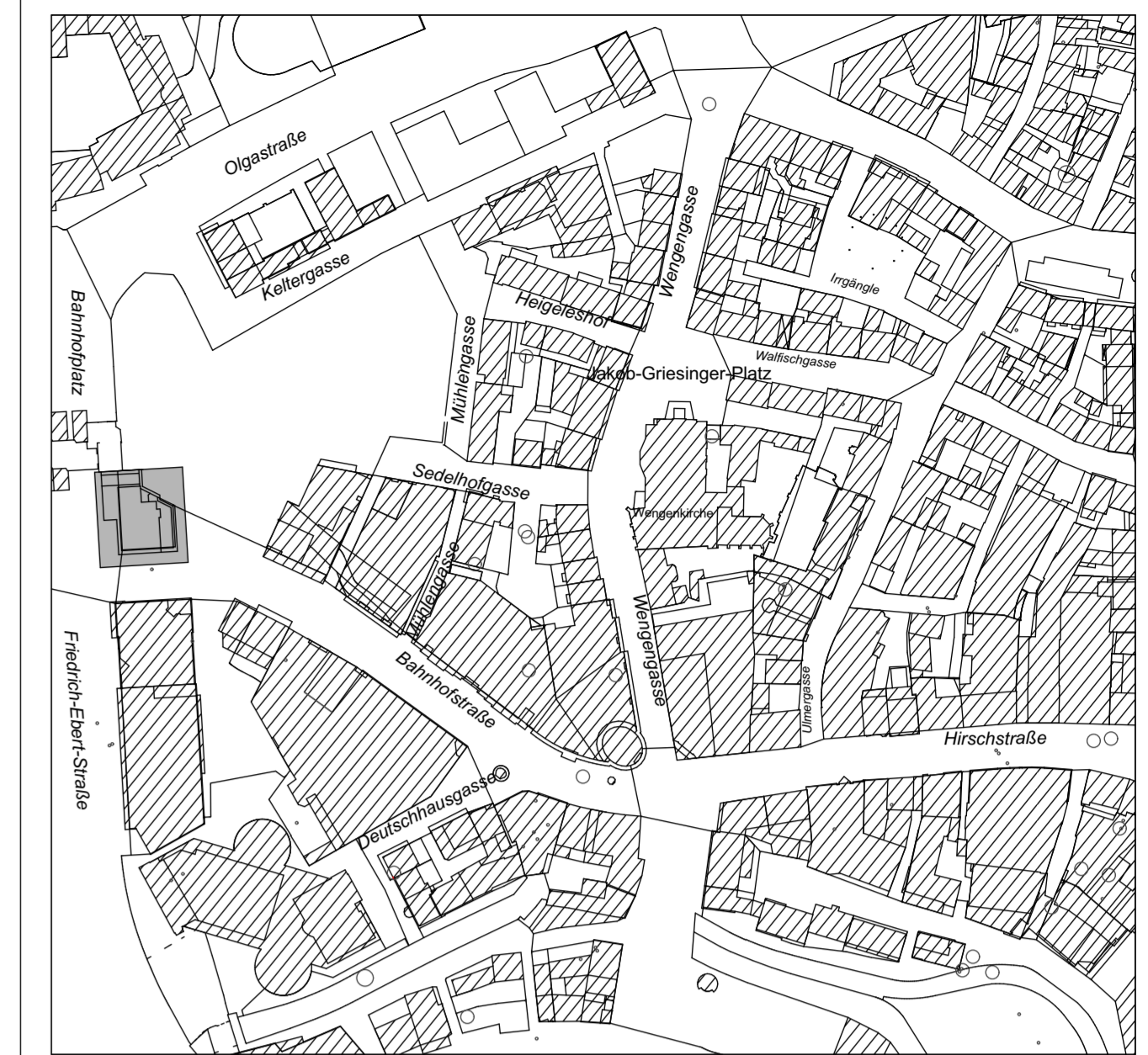
Übersichtsplan M 1 : 2500

Werden bei Aushubarbeiten Verunreinigungen des Bodens festgestellt wie z.B. Müllrückstände, Verfärbung des Bodens, auffälliger Geruch oder ähnliches, ist die Stadt Ulm sofort zu benachrichtigen.