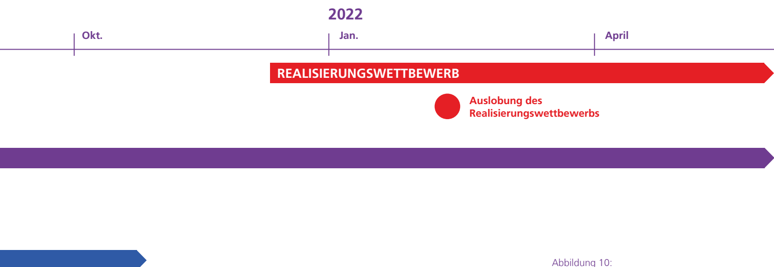
Abbildung 10: Die zwei Verfahren im Überblick

Zwei Planungsinstrumente oder -verfahren dienen dazu, die Umsetzung der Neugestaltung mit Einbindung der Bürgerschaft vorzubereiten: ein Realisierungswettbewerb zur Neugestaltung der Fußgängerzone und die vorbereitenden Untersuchungen zum Sanierungsgebiet. Die vorbereitenden