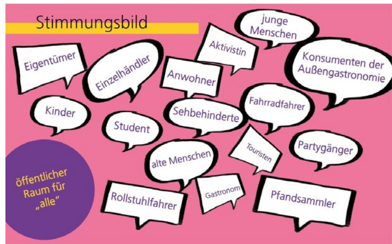
Abbildung 18: Im Fachgespräch Soziales wurde die Innenstadt für „alle“ diskutiert.

In allen Themenräumen wurde auf digitalen Pinnwänden (Miro) Beiträge der Teilnehmenden festgehalten und Orte, die diskutiert wurden, auf einer Karte markiert (s. Abbildung 19: Diskussionspunkte aus dem Dialog wurden auf einer Kartengrundlage festgehalten).