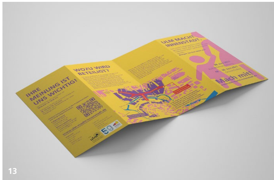
Abbildungen 12, 13: Informationsflyer „Ulm macht Innenstadt“