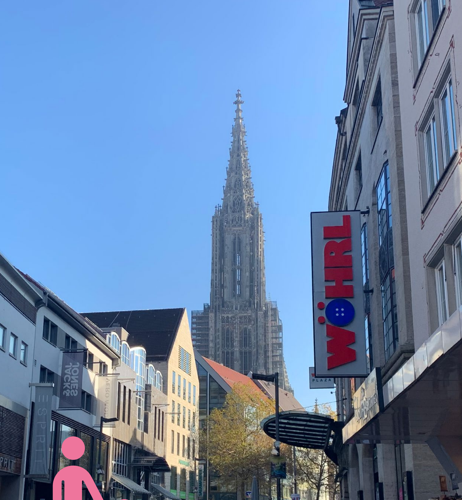
Abbildung 1: Ist-Zustand der Fußgängerzone (Hirschstraße Blickrichtung Ost)