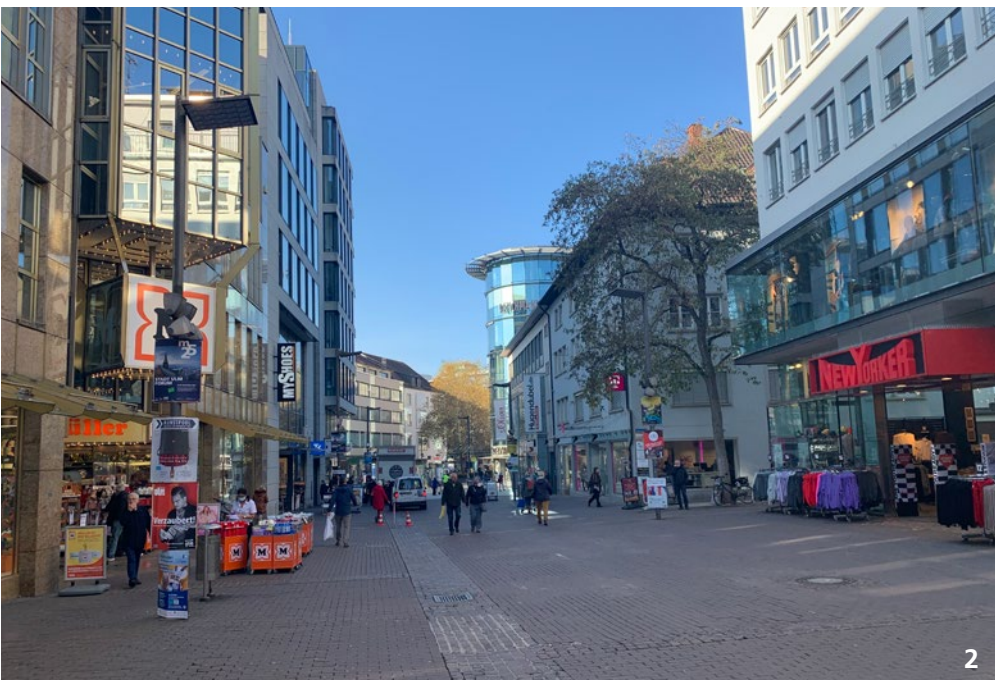
Abbildung 2: Ist-Zustand der Fußgängerzone (Hirschstraße Blickrichtung West)

geeigneten Maßnahmen zu mindern. Der beginnende Planungsprozess zur Umgestaltung wurde durch den Beteiligungsprozess „Ulm macht Innenstadt“ begleitet. Er baute auf den Erkenntnissen des Innenstadtdialogs auf ( https://www.zukunftsstadt-ulm.de/dialog/informationen/innenstadtdialog ), bei dem bereits zahlreiche Anregungen aus der Öffentlichkeit gewonnen werden konnten. Ein zentrales Ergebnis aus dem Innenstadtdialog war, dass die Fußgängerzone grundsätzlich neugestaltet werden sollte. Die im Innenstadtdialog beschlossenen Bausteine und herausgearbeiteten Handlungsempfehlungen werden aufgegriffen und im Planungsprozess zur Neugestaltung weiterentwickelt. Der Beteiligungsprozess „Ulm macht Innenstadt“ 2021 wurde daher bewusst auf einigen Ergebnissen und Handlungsempfehlungen aus der Beteiligung der Ulmer Bürgerschaft aufgebaut. Die Schwerpunkte der Diskussion im Rahmen von „Ulm macht Innenstadt“ lagen dabei auf den Themen Stadtraum / Stadtgestalt, Nutzungen, Soziales, Mobilität und Ökologie.