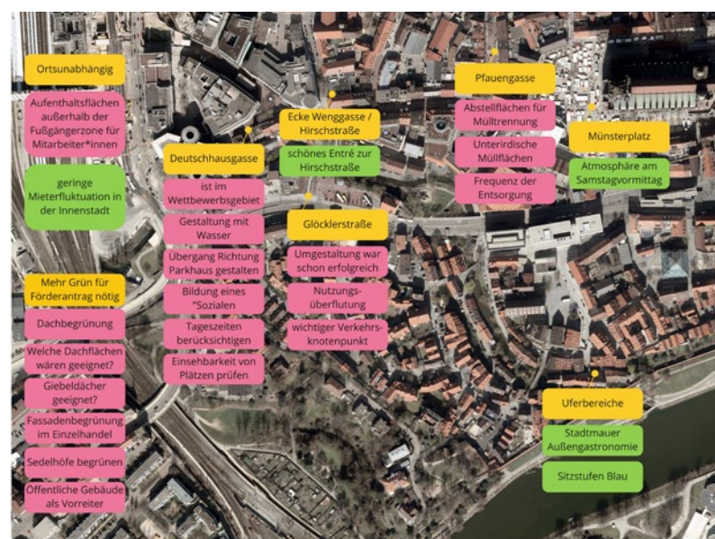
Abbildung 19: Diskussionspunkte aus dem Dialog wurden auf einer Kartengrundlage festgehalten

Legende Orte Herausforderungen Schützenswertes