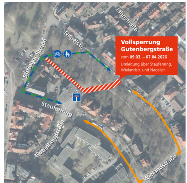
Entsiegelungskonzept - Gutenbergstraße