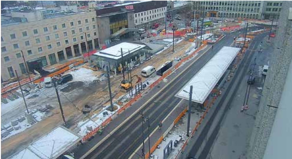
In Blickrichtung NORD