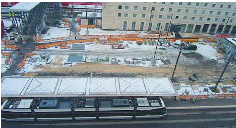
In Blickrichtung SÜD