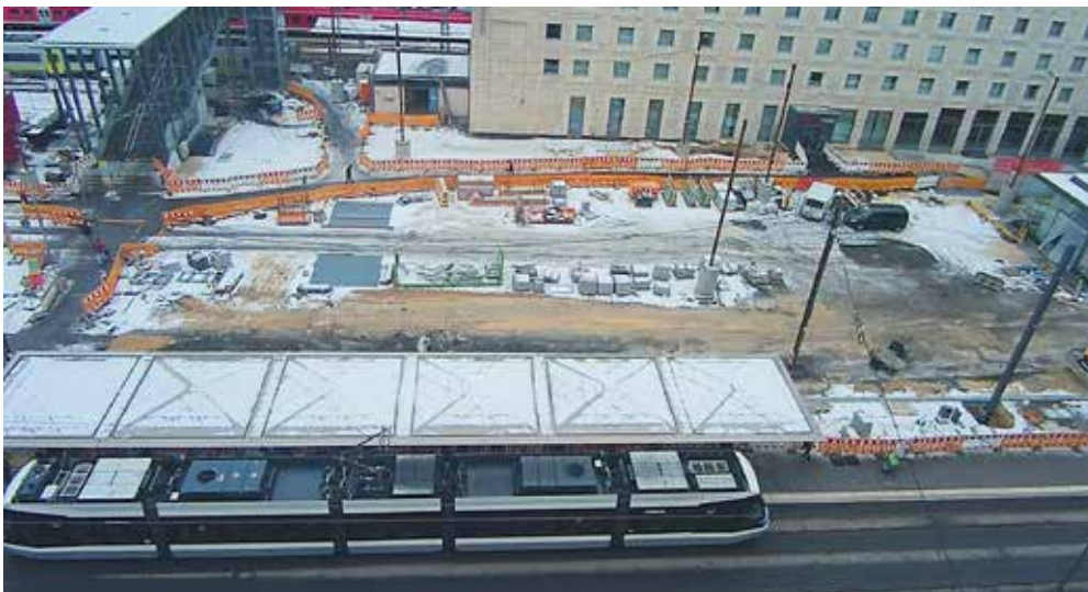
In Blickrichtung WEST