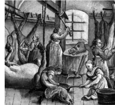
Ein Schlachthaus in München, 1783, Münchner Stadtmuseum

In den mittelalterlichen Städten war es seit etwa 1100 nur den Mitgliedern der entsprechenden Zunft erlaubt, ein Handwerk auszuüben. Handwerkerfrauen führten die Bücher, verwalteten die Kasse und verkauften die Produkte. Teilweise wurden auch Frauen als selbstständige Meisterinnen Mitglieder der Zunft. Die wirtschaftlichen Möglichkeiten der Meisterinnen waren dennoch durch die Vormundschaft des Ehemannes oder des Vaters beschränkt. Ab 1600 wurden Frauen zunehmend aus den Zünften ausgeschlossen.