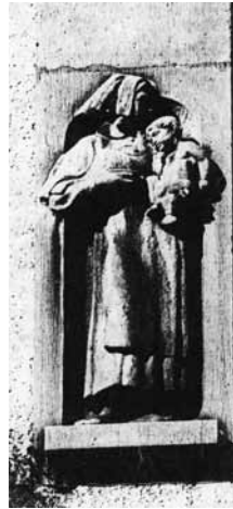
Darstellung einer Diakonisse an der Eingangsfassade des städtischen Krankenhauses am Safranberg

Die Tradition der christlichen Krankenpflege durch Frauen wurde durch die Jahrhunderte weitergeführt. 1854 organisierten Barmherzige Schwestern aus Ehingen ambulante Pflegedienste in Ulm. 1855 kamen die ersten Diakonissen ins Ulmer Spital.