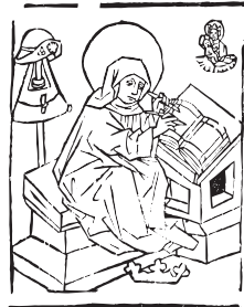
Die heilige Birgitta von Schweden am Schreibpult, Holzschnitt, Söflingen, 1450/60

Der Orden der Klarissen geht auf die Adlige Klara Sciffi (1193/94 – 1253) zurück. Klara hatte sich Franz von Assisi angeschlossen, der für die Schwesterngemeinschaft eine kurze Regel verfasst hatte.