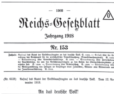
Aufruf des Reichsgesetzblatt vom 12. November 1918

Die Novemberrevolution in Deutschland führte nicht nur zur Abdankung des Kaisers, sondern ist auch die Geburtsstunde des Frauenwahlrechts. Am 1. August 1919 wird das Frauenwahlrecht in der Weimarer Verfassung verankert.