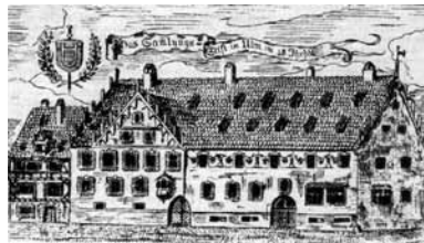
Westfassade des Sammlungsstifts in der Frauenstraße. Die Gebäude fielen 1944 den Bomben zum Opfer.

Die Sammlungsschwestern förderten das Sozial- und Bildungswesen der Stadt, indem sie beispielsweise eine Schulspeisung und Stipendien für bedürftige Schüler finanzierten. Seit dem 15. Jahrhundert verstärkte der Ulmer Rat – gegen den Widerstand der Sammlungsfrauen – seinen Einfluss auf die Geschicke der Gemeinschaft und übernahm im 16. Jahrhundert, nachdem die Institution in der Reformationszeit in ein evangelisches Damenstift umgewandelt worden war, die Verwaltung. Dennoch blieb die Sammlung bis zum Ende der reichsstädtischen Zeit ein kulturelles Frauenzentrum.