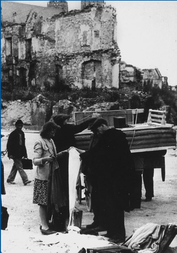
Bedingt durch die prekäre Versorgungssituation in den ersten Nachkriegsjahren blühte der Schwarzmarkt bis zur Währungsreform 1948

die sogenannten Displaced Persons, insbesondere jüdische und ukrainische Flüchtlinge, untergebracht waren, die auf die Rückführung in ihre Heimat oder die Erlaubnis zur Auswanderung warteten.