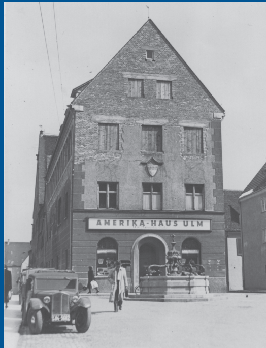
Nachhilfe zum Thema „Democratic way of life“ bot den Ulmerinnen das Angebot des Ulmer Amerikahauses in den Räumen des Ulmer Museums