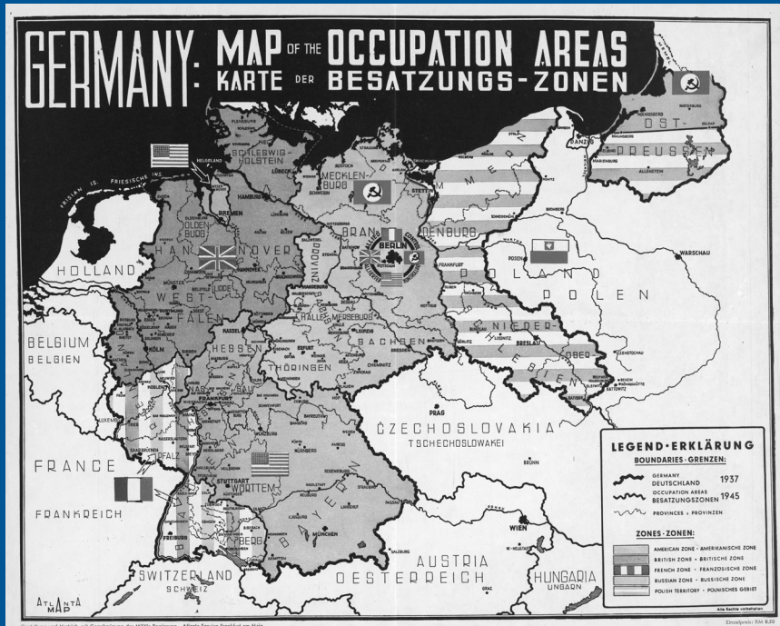
Deutschland unter Alliiertes Besatzung (1945)

Zone. Eines dieser Instrumente war der vielzitierte Marshallplan von 1948, der die gesamte westeuropäische, vor allem aber die deutsche Wirtschaft ankurbeln sollte. Von einer grundlegenden Demokratisierung Deutschlands versprochen die Amerikaner sich die Auflösung alter Feindbilder und ein Zusammenrücken Europas gegen den Kommunismus. Der Aufbau der Demokratie in Deutschland lag auch im Sicherheitsinteresse der Vereinigten Staaten.