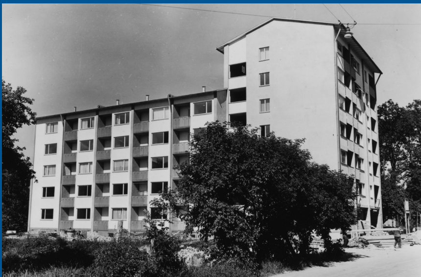
Die „Drachenburg“ – das erste in Eigeninitiative errichtete Wohnheim für alleinstehende Frauen des Überparteilichen Frauenarbeitskreises

Beweis dafür, daß eine erfolgreiche Initiative zur Lösung eines Problems auch einmal von unten ausgehen kann. Im Grunde hat der Überparteiliche Frauenarbeitskreis nur vorexerziert, wie man in einer Demokratie solche Dinge anpacken soll.“ 7