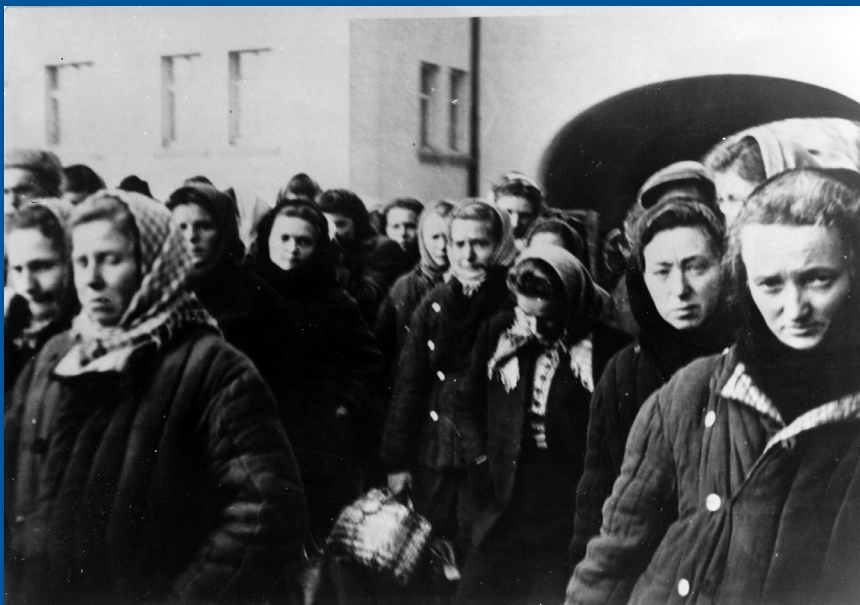
Russlandheimkehrerinnen bei der Ankunft in der Kienlesbergkaserne (1948)

die Wäsche der Heimkehrer gestopft, Armeemäntel umgearbeitet, Kleider aus alten Gardinen, Flügeldecken und Fallschirmseide genäht. Besondere Unterstützung bekamen die Flüchtlinge auf dem Kienlesberg in Form von Wollsocken, Seife und einem weißen Taschentuch, als „bescheidenstes Stück Kultur, das ihnen fremd geworden war.“