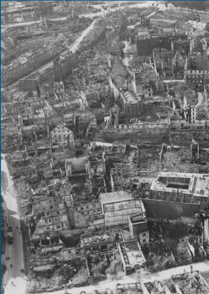
Ulm in Trümmern: Blick vom Münster auf Pfauen-, Wengen- und Ulmergasse sowie die Bahnhofstraße (1945)

Als die Amerikaner Ulm am 24. April 1945 besetzten, stießen sie auf keinen nennenswerten Widerstand. Die nationalsozialistische Führungsspitze der Stadt hatte sich rechtzeitig in Sicherheit gebracht und Befehl gegeben, die Donaubrücken zu sprengen. Ulm lag nach den schweren alliierten Luftangriffen der letzten Monate in Trümmern. Etwa 300.000 Bomben hatten dafür gesorgt, dass fast 60 Prozent der Stadt und 75 Prozent aller Gewerbebetriebe zerstört waren. Die Wasser-, Gas- und Stromversorgung war größtenteils lahmgelegt. Gleiches galt für die Telefon- und Postver-