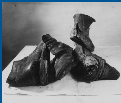
Schuhwerk von Russlandheimkehrern (1949)