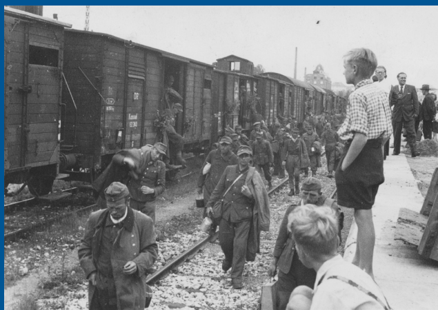
Zerrissene Familien: Warten auf die Männer, Warten auf die Väter

politischen Großwetterlage beeinflusste in der Folgezeit auch das Verhältnis zwischen Siegern und Besiegten. Je größer die Spannungen zwischen den westlichen Alliierten und der Sowjetunion wurden, desto intensiver gestaltete sich die Aufbauarbeit in der amerikanischen