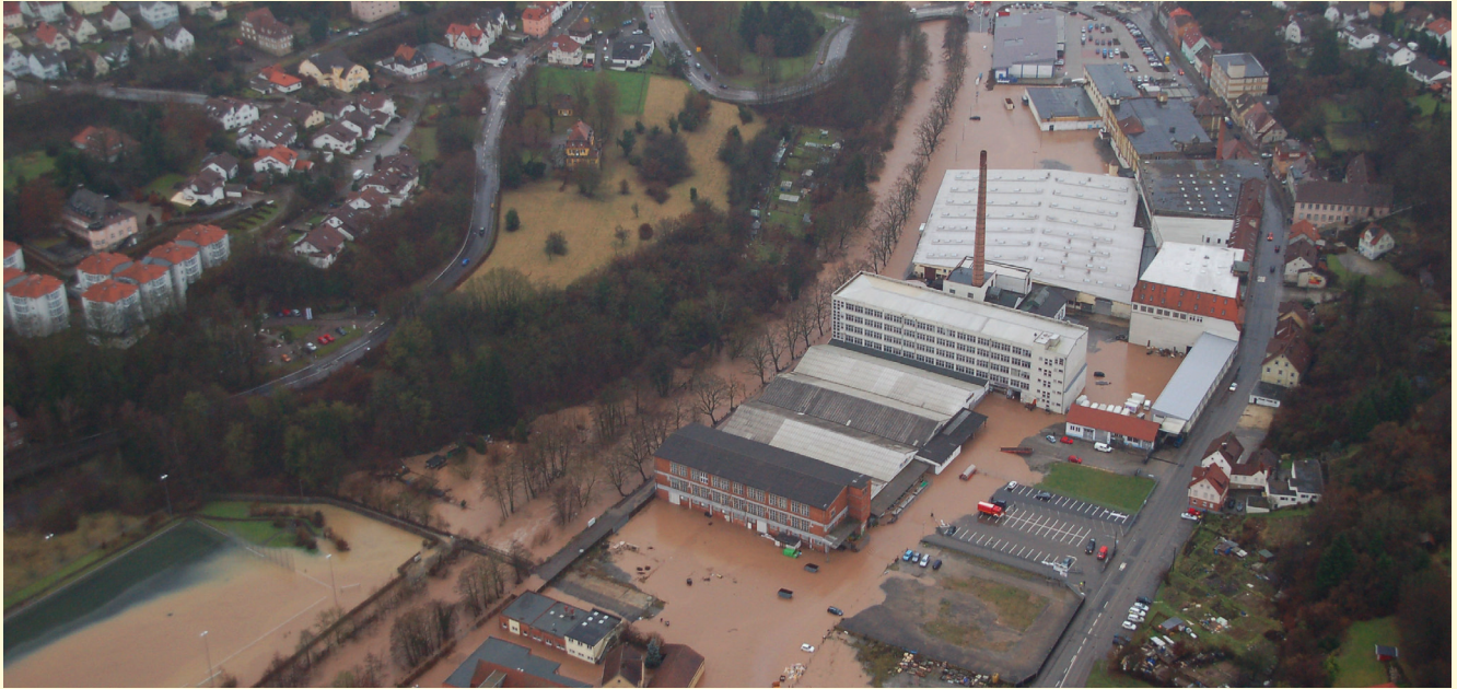
Backnang an der Murr, Januarhochwasser 2011

i Der Führungsebene von Unternehmen wird empfohlen, Verantwortliche zu benennen, die sich über bestehende Risiken informieren und geeignete Gegenmaßnahmen in die Wege leiten.