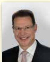
Gunter Czisch Oberbürgermeister Stadt Ulm