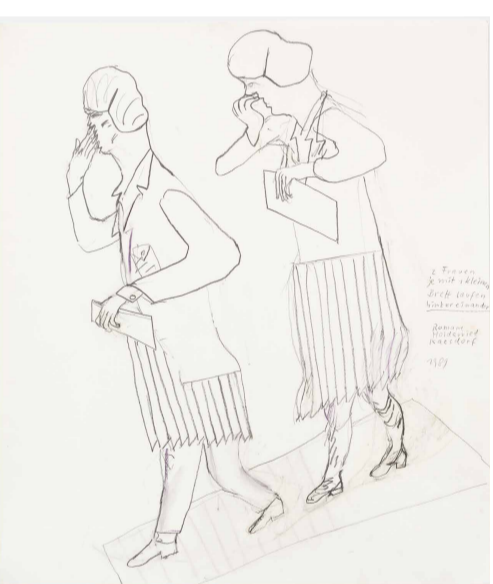
Abbildungen von oben nach unten: Romane Holderried Kaesdorf: „2 Frauen je mit 1 kleinen Brett laufen hintereinander“, 1989, Zeichnung, Sammlung Familie Deschler /// Walter Zeischegg: Sinus-Aschenbecher, 1966, HfG-Archiv, Museum Ulm ///

H Angebot im HfG-Archiv Am Hochsträß 8, 89081 Ulm (Abbildung oben)